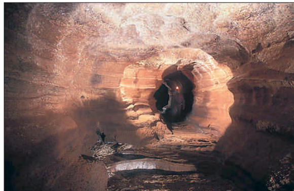
Chaque galerie réserve ses surprises (GM)