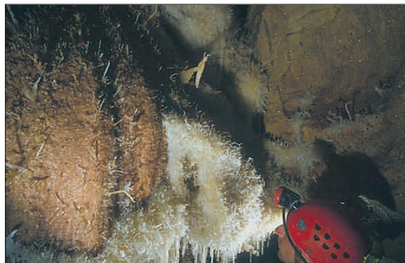
Le fond du réseau IV est particulièrement fragile (GM)

Tout comme pour la traversée aven Despeysse - grotte de Saint-Marcel, il convient de prendre contact avec le CDS 07 ou le SCSM au préalable.